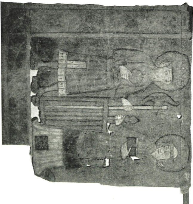
Detalj av processionsstanan från Hennesjö gamla kyrka med Sankt Olof med skäggyrnan och diakonen Lars med halstret. Baksidan.

I verkligheten kan vi inte längre här i Sverige få uppleva sådana skådespel. Det närmaste vi kan komma till är demonstrationstågen på första maj. De kyrkliga processioner som ännu äger rum hos oss, t. ex. vid installationer och kyrkoinvigningar, och där ännu skrudar kommer till användning kan visserligen ge en glimt av medeltida kyrkoprakt, men de saknar något väsentligt, nämligen korsfanorna. Sådana är alltfjänt — under den modernare men inte alldeles riktiga